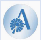
IMMAGINE CHE ABBIAMO DI NOI